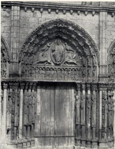
Историско-уметнички фотограф, Париз

и борбено величанствен, родно се баш у споменутом краљевском домену средњовековне Француске. Ту су крајем XII током XIII века просто нишале катедрале. У једном периоду само створена су чуда какве су катедрале у Шартру, Ренсу, Буржу, Са архитектурно се истовремено развијало нарочито статуарно вајарство, и чудесно комбинација барелефних радова. У ту уметничку утакмину ступили су и огромни прозори и руже од бојеног стакла. Готика је сва у тенденцији танког, мршаваг, нервног шпикања у вис, она је дакле смањивала зидне масе, остављала само оно што држи структуру, а велике празнине