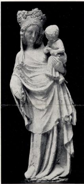
КАТЕДРАЛА У ШАРТРУ, БОГОРОДИЦА СА ДЕТЕТОМ

нову позу материје у простору, и према томе неки особит тон светлости. А оне огромне статуе, због каменитих балдахина над главама који сенче, и због тамних међупростора од тела до тела, чине се, према добу дана, час као да су више иступиле у простор, час као да се јаче прљубиле уз своје стубове. Само